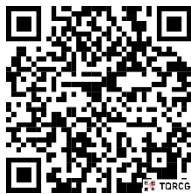
পল্লী উন্নয়ন একাডেমি, জামালপুরের টেলিটক পোর্টালে প্রবেশের QR Code