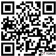
পল্লী উন্নয়ন একাডেমি, জামালপুরের ওয়েবসাইটে প্রবেশের QR Code

** শেষ তারিখ ও সময়ের জন্য অপেক্ষা না করিয়া হাতে যথেষ্ট সময় নিয়ে অনলাইনে আবেদনপত্র পূরণ ও আবেদন ফি জমাদান করিতে পরামর্শ দেওয়া হইলো।